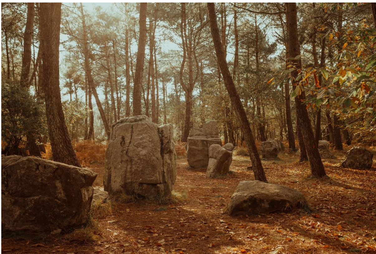
Alignements de Kerzerho – Coët Er Blei à Erdeven

Conçu par les médiateurs du patrimoine du conseil départemental du Morbihan et en collaboration avec les enseignants partenaires, ce dossier pédagogique est un outil documentaire pour préparer ou prolonger la découverte de l'exposition avec votre classe. Il présente le contenu de l'exposition, des ressources en lien et des pistes d'exploitation en classe en amont ou après la visite.