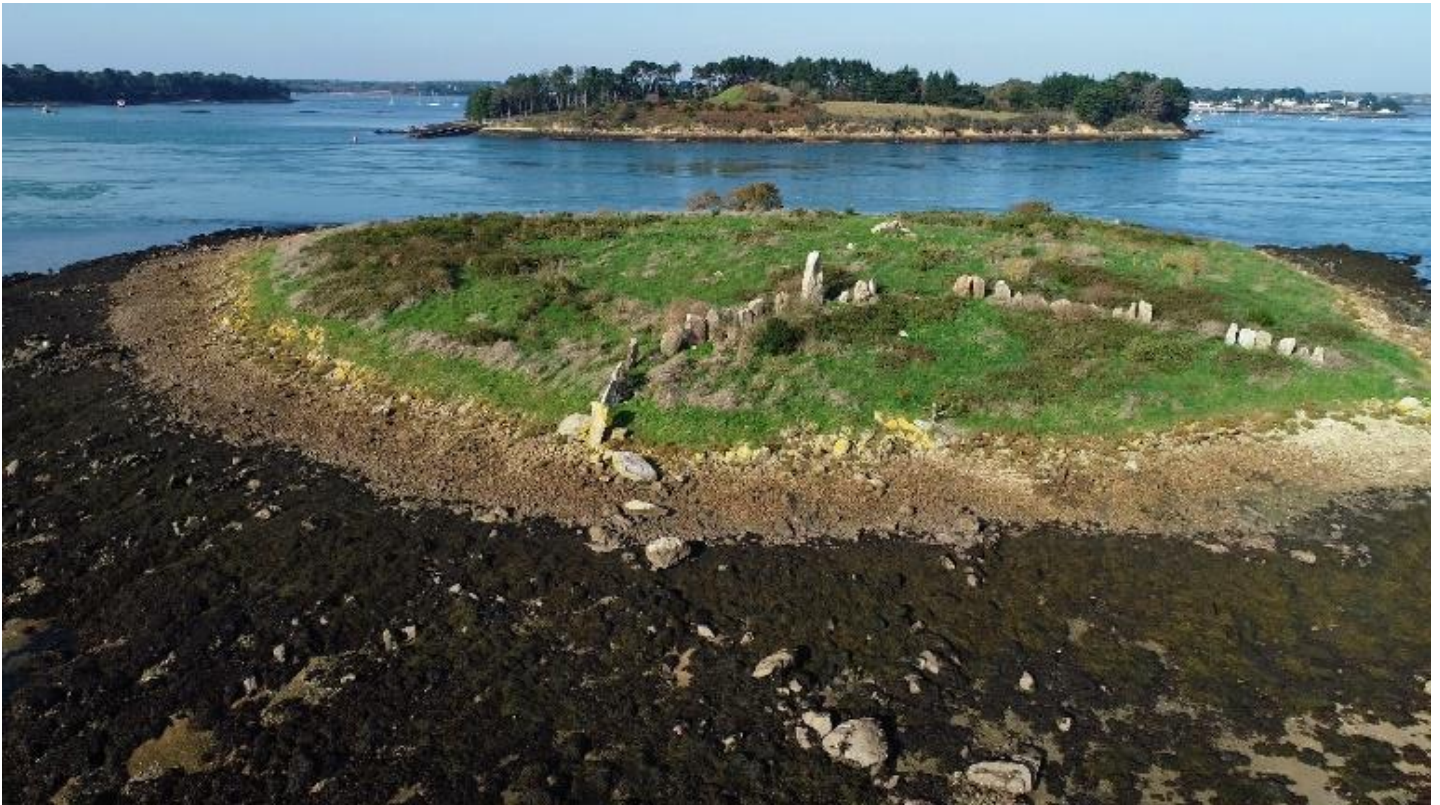
L'îlot d'Er Lannic et le cairn de Gavrinis (Larmor-Baden).